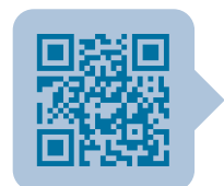
mehrsprachige Folder und Kontakte

Die Erziehungsberechtigten müssen umgehend die Koordinierungsstelle verständigen, wenn Jugendliche nicht innerhalb von vier Monaten nach Beendigung oder vorzeitiger Beendigung eines Schulbesuches oder einer beruflichen Ausbildung eine Bildungs- oder Ausbildungsmaßnahme begonnen haben. Die Koordinierungsstelle ist unter 0800 700 118 kostenlos aus ganz Österreich erreichbar.