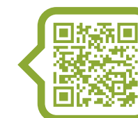
Bildungsinformation nach der 8. Schulstufe

TELEFONHOTLINE MO-FR 8-20 UHR UND SA 8-12 UHR (KOSTENLOS & VERTRAULICH): 0800 211320