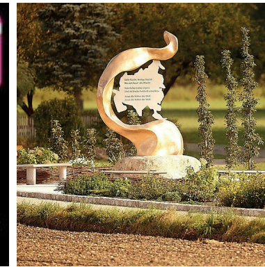
Franz Xaver Gruber Friedensweg