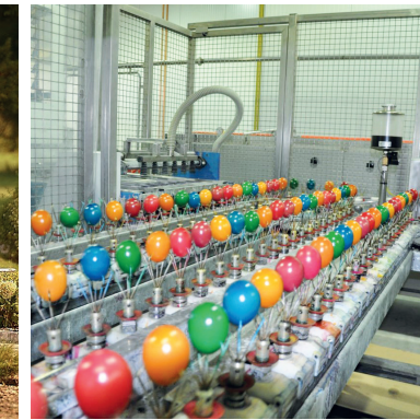
Eierfärbeanlage Steiner Ei