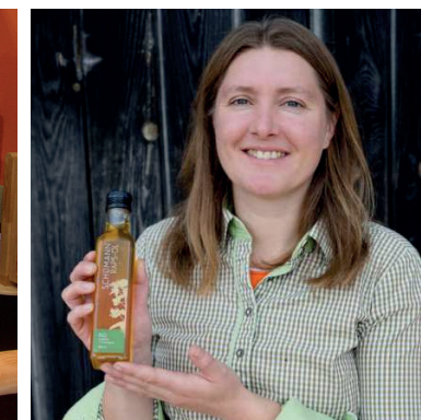
Bio Essig Öl Schumann