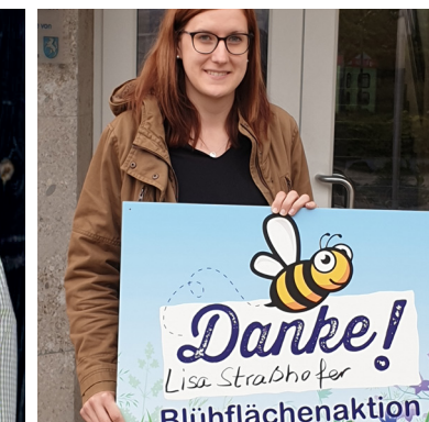
Wilder Garten - Blühflächen Mattigtal